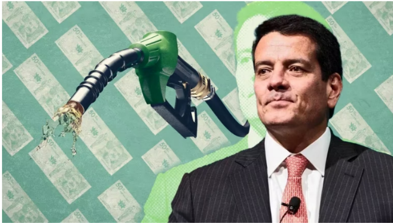
Felipe Bayón, presidente de Ecopetrol , considera que la gasolina debería estar más cara.

La gasolina en Colombia, por sexto mes consecutivo tuvo un incremento en el galón. En el más reciente ajuste, el aumento fue de 400 pesos, uno de los más altos de los que se han visto recientemente. Si bien los reajustes se deben por el déficit en el Fondo de Estabilización de Precios de los Combustibles (FEPC) , algunos consideran que los valores deberían ser mucho más altos, entre esos está el presidente de Ecopetrol , Felipe Bayón .