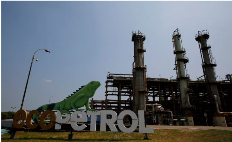
Utilidades históricas de Ecopetrol darían los mejores dividendos en la historia a los accionistas minoritarios, pero, no alcanzaría a pagar el déficit del FEPC.