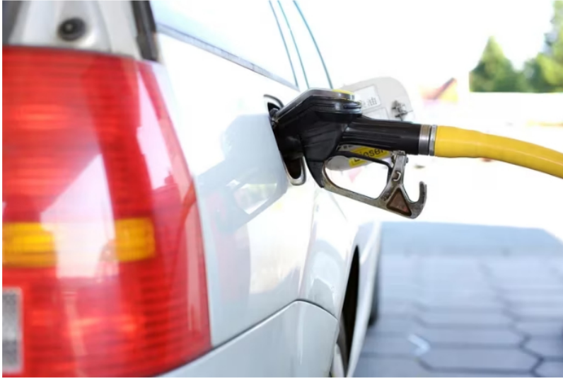
Propuesta de Ecopetrol no alcanzaría para pagar el déficit del FEPC.

Este sería el monto más alto que le pagarían a los accionistas minoritarios, un 32,3% más que lo entregado el año pasado, pero, que podría descuadrarle las cuentas a Gustavo Petro. El Gobierno nacional planeaba saldar la totalidad de la deuda del FEPC con los dividendos, pero, esta propuesta de Ecopetrol sería considerablemente más baja a la que presupuestaban, permitiendo recibir casi 800 pesos por acción, lo que le permitiría sanear el déficit por completo.