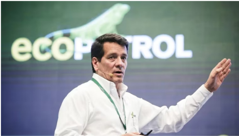
Felipe Bayón, presidente de Ecopetrol , dejará el cargo el 31 de marzo con las utilidades más altas en la historia de la compañía.

“En el 2022 se registraron ingresos por COP 159.5 billones, una utilidad neta de COP 33.4 billones, un EBITDA de COP 75.2 billones, y un margen EBITDA de 47.2%. Por su parte, el indicador deuda bruta/EBITDA fue de 1.5 veces y el retorno sobre capital empleado (ROACE) fue de 18.8 %. Durante 2022 invertimos USD 5,488 millones (COP 23.4 billones), cifra que se ubicó en el rango alto de la meta de USD 4,800 – 5,800 millones (COP 20.4 – 24.7 billones) planteada para el 2022 y que evidenció un crecimiento del 26.1% frente al 2021”, detalló el presidente de la compañía, Felipe Bayón.