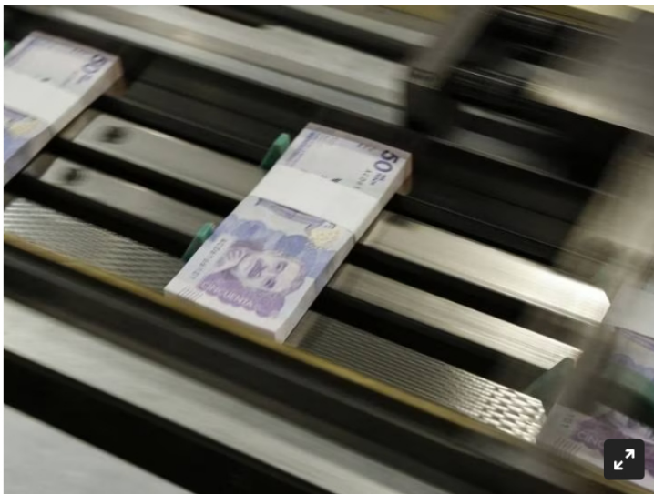
Imagen de referencia dinero por Banco de la República / Juan Paez (Colprensa)

El Emisor obtuvo resultados por $1,7 billones, de los cuales $1,5 billones correspondieron a la utilidad del ejercicio.