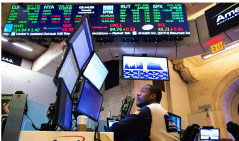
Acciones colombianas en Wall Street.

Las acciones de empresas colombianas que cotizan en la Bolsa de Nueva York en EE. UU. y la Bolsa de Toronto en Canadá tuvieron un mes de febrero negativo, si se tiene en cuenta que la mayoría de las compañías cerraron con números rojos.