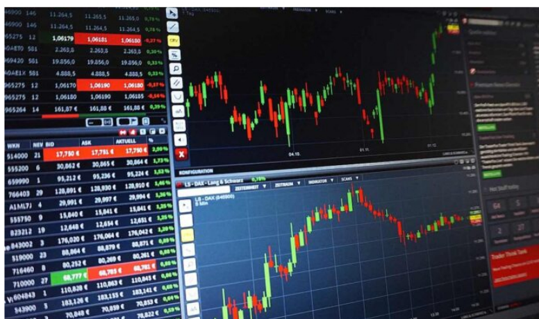
Comportamiento de las acciones colombianas a febrero.

A diferencia del primer mes del año en el que el MSCI Colcap creció 0,31 %, en febrero el índice que mide las principales acciones de la bolsa de valores de Colombia (bvc) terminó con caídas.