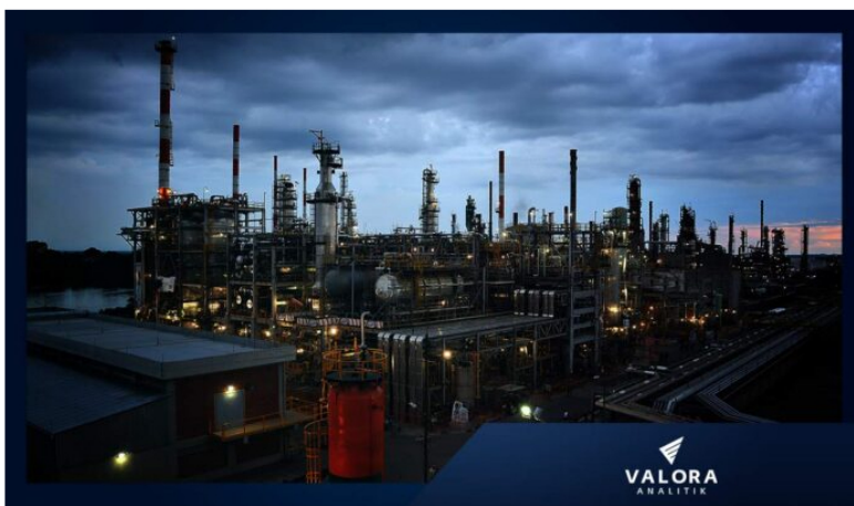
Ecopetrol Refinería de Barrancabermeja.

Ecopetrol informó este martes que logró un desempeño positivo en materia de producción de petróleo, pues cerró 2022 en 709.500 miles de barriles de petróleo equivalente por día (kbped).