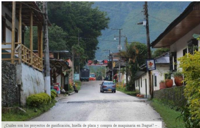
¿Cuáles son los proyectos de gasificación, huella de placa y compra de maquinaria en Ibagué? –

Desde la Secretaría de Desarrollo Rural explicaron los avances de estos tres proyectos emblemáticos que el gobierno local tiene previsto ejecutar durante esta legislatura.