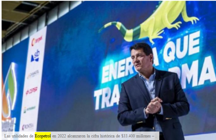
Las utilidades de Ecopetrol en 2022 alcanzaron la cifra histórica de $33.400 millones - .

Durante 2022, el Grupo Ecopetrol continuó entregando resultados operativos y financieros históricos, superiores a las metas planteadas a principios de año. Se registraron ingresos por 159.500 millones de pesos, una utilidad neta de 33,400 millones de pesos y un Ebitda de 75.2 miles de millones de pesos y un margen Ebitda de 47.2 por ciento.