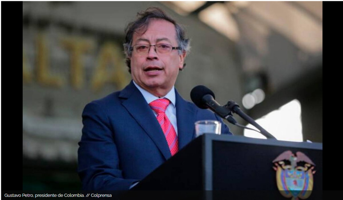
Gustavo Petro, presidente de Colombia.

El Consejo Nacional Electoral investiga presuntas inconsistencias en la financiación de su campaña a la Presidencia de Colombia.