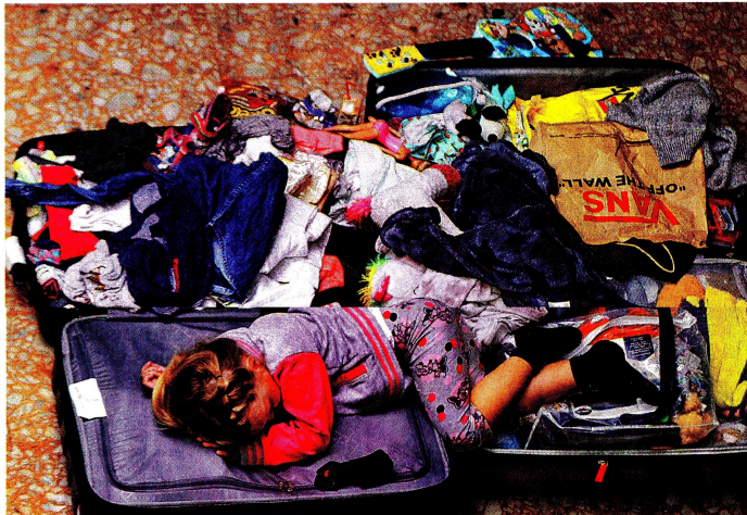
En medio del caos, una niña duerme sobre equipaje en el aeropuerto José María Córdova (Rionegro).

www.eltiempo.com | @ELTIEMPO | eltiempo | @eltiempo | APP El Tiempo