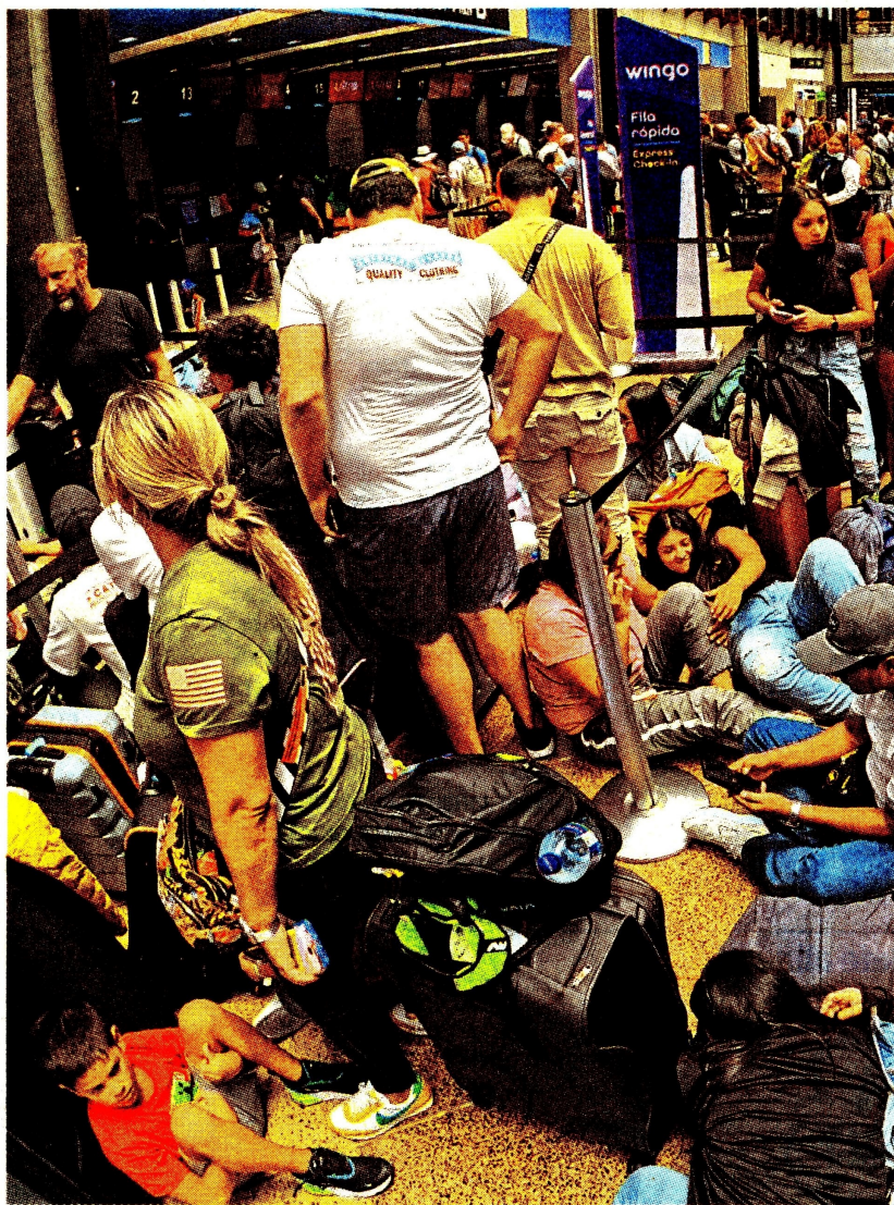
Ayer hubo fuerte tensión en varios aeropuertos, por el caso de Viva.

Dejar en tierra los aviones de esta aerolínea afecta a más de 16.000 viajeros al día. Si bien hay plan para moverlos en otras empresas, es incierto qué sigue para la 'low cost'.