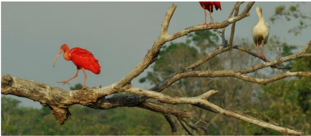
Arauca tiene 453 especies de aves en su territorio

En cuanto al tema de la seguridad, el alcalde Tovar sostiene que Arauca ha sido “estigmatizada por un conflicto de hace más de 40 años en la zona rural” , pero hoy es un lugar en el que “la gente puede caminar tranquila, nada les va a pasar” .