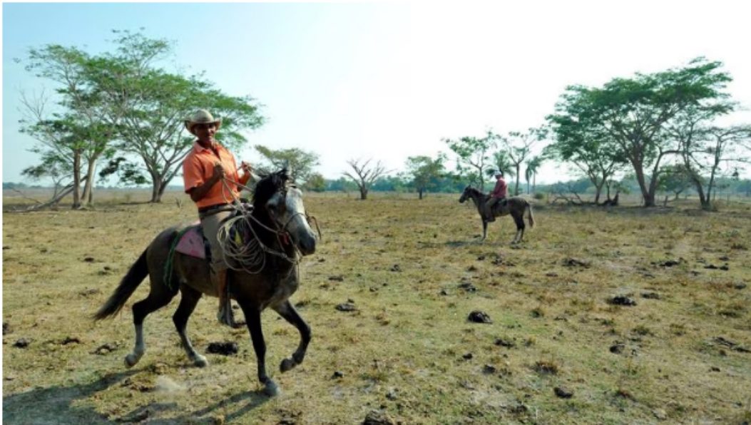
Habitantes de zona rural de Arauca

Otra fuente importante de ingresos es la producción agrícola de la zona: cientos de hectáreas de cultivos de cacao, plátano, caña de azúcar, papaya, achiote, limón, naranja, piña, arroz y maíz; que aportan el 30 por ciento del PIB al departamento.