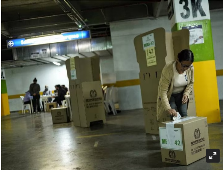
Imagen de referencia de votaciones.

Ante el riesgo de financiación irregular en las elecciones de autoridades locales, el convenio permitirá acceso a bases de datos para intentar blindar el certamen electoral.