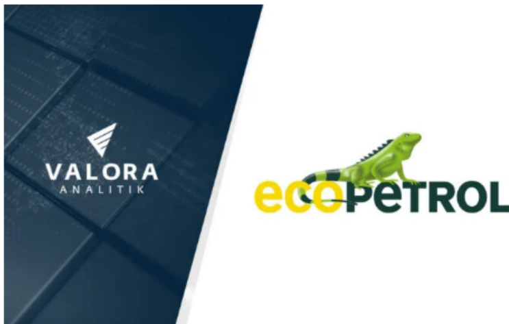
Ecopetrol sale al mercado a emitir bonos internacionales.

Este miércoles, 28 de junio de 2023, se conoció el prospecto de emisión de bonos internacionales por parte de la petrolera colombiana, Ecopetrol .