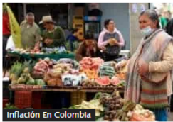
Inflación En Colombia

Costo de vida y economía, entre las mayores preocupaciones de los colombianos, dice una encuesta