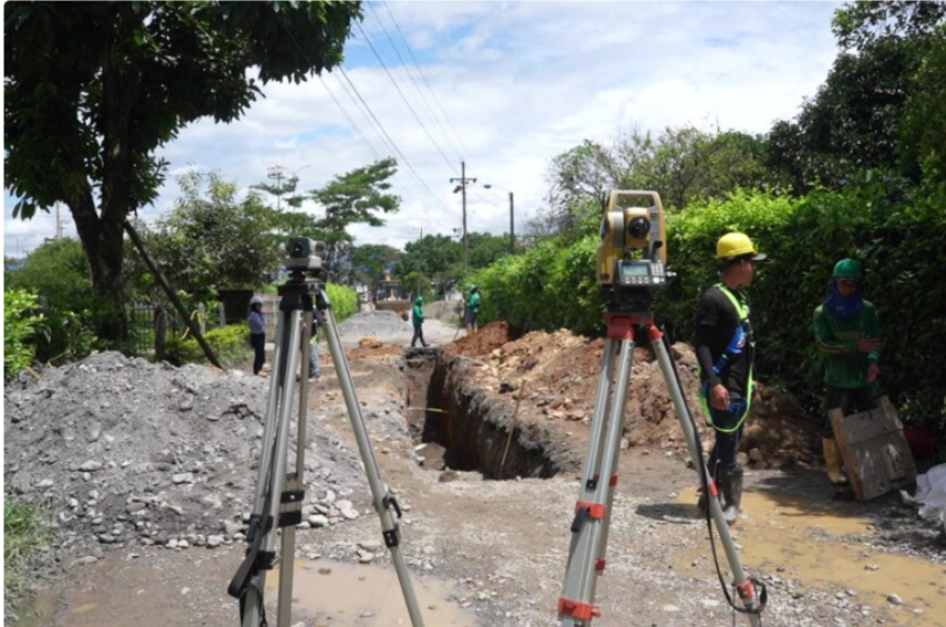
Ecopetrol mejorará vías terciarias de Acacias, Guamal y Castilla

Ecopetrol invertirá $29.223 millones en la reparación de cuatro vías terciarias que suman 60 kilómetros, para mejorar la conectividad, movilidad y transporte de más de 35 mil habitantes, así como de alimentos y mercancías que transitan por zonas rurales de los municipios de Acacias, Guamal y Castilla La Nueva, en el departamento de Meta.