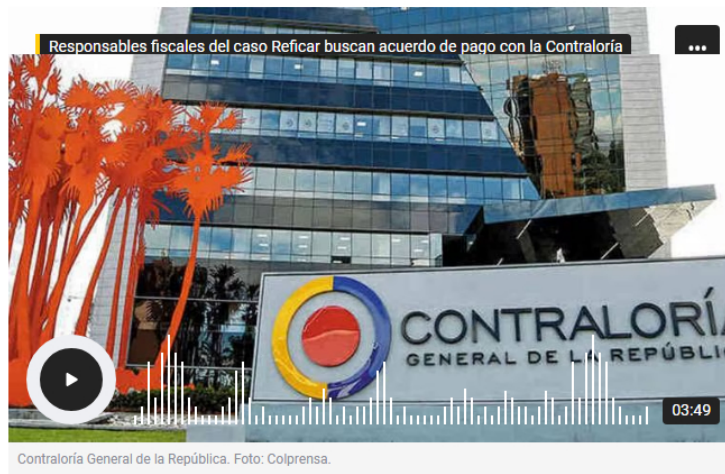
Contraloría General de la República.

El contralor encargado reveló en primicia para La W que los responsables fiscales del detrimento en la modernización de Reficar han buscado a la Contraloría con el interés de hacer un acuerdo de pago.