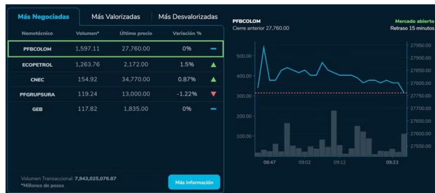
Ahora bien, volviendo a la BVC, hay que destacar el buen comportamiento de las acciones de PFBCOLOM , que crecen pese a no ser las más negociadas del mercado y por ahora repuntan un 1,5% y alcanzan un precio por acción de 2.172 pesos.

Otra de las preocupaciones grandes que hay entre los operadores, analistas y expertos, está relacionada con saber qué pasará con las reformas sociales que adelanta el gobierno Petro. Esto, puesto que el jefe de Estado indicó recientemente que volverá a presentar la fallida reforma laboral ante el Congreso y esto revivió el nerviosismo, puesto que ha sido uno de los proyectos más criticados por los empresarios, quienes sostienen que esto disparará la informalidad laboral y golpeará la generación de nuevos puestos de trabajo.