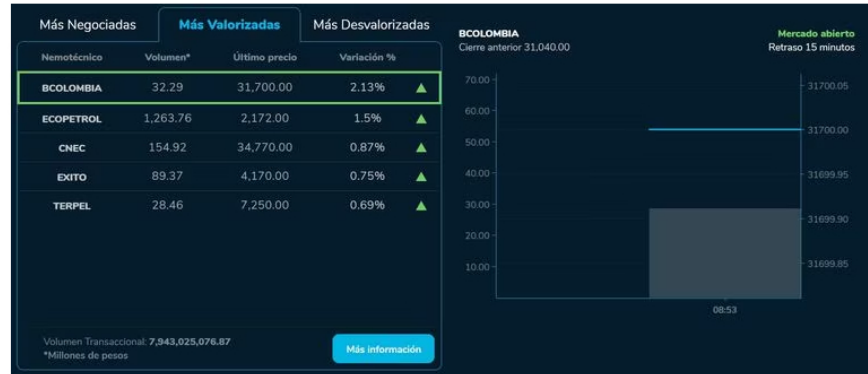
Dando un vistazo a las otras tres grandes referencias de la bolsa colombiana, se aprecia un panorama dispar en el que el Coleqty cae un -0,3 % a 796,97 unidades y el Colir cede un -0,32 % a 744,52 unidades.

En lo que concierne a los mercados de renta fija, estos muestran poco movimiento por ahora, aunque se mantienen en terreno positivo.