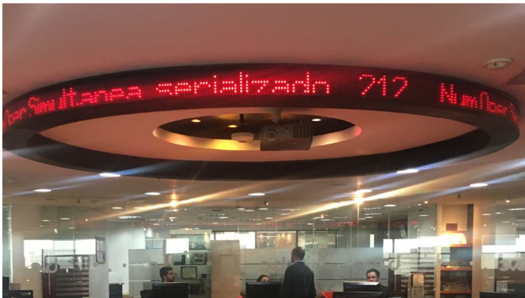
Este no ha sido un buen mes para la Bolsa de Valores de Colombia.

La Bolsa de Valores de Colombia (BVC) y Ecopetrol siguen luchando por mantenerse a flote en medio de la fuerte inestabilidad que se siente en esta plaza bursátil.