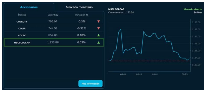
La Bolsa de Valores de Colombia y BVC siguen luchando por mantenerse a flote en medio de la fuerte inestabilidad que se siente en esta plaza bursátil y este lunes — 26 de junio — comenzaron la semana con indicadores y resultados dispares.

Cabe recordar que el pasado viernes el Colcap acabó en 1'133,54 unidades, perdiendo de esta forma un 0,71 % respecto a las 1.141 que marcaron la referencia.