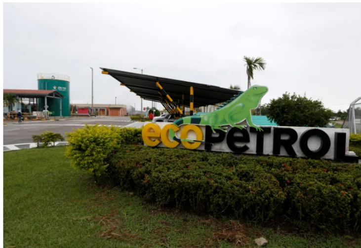
Foto de archivo. Entrada de la plataforma petrolera Castilla de Ecopetrol en Castilla La Nueva, departamento del Meta, Colombia, 26 de junio, 2018.

Por Muyu Xu. KUALA LUMPUR (Reuters) - La colombiana Ecopetrol está logrando mantener las ventas a Asia en torno al 45% de su producción de crudo, aunque la rivalidad con el petróleo ruso le está obligando a ofrecer mayores descuentos, dijo el lunes un ejecutivo de alto rango.