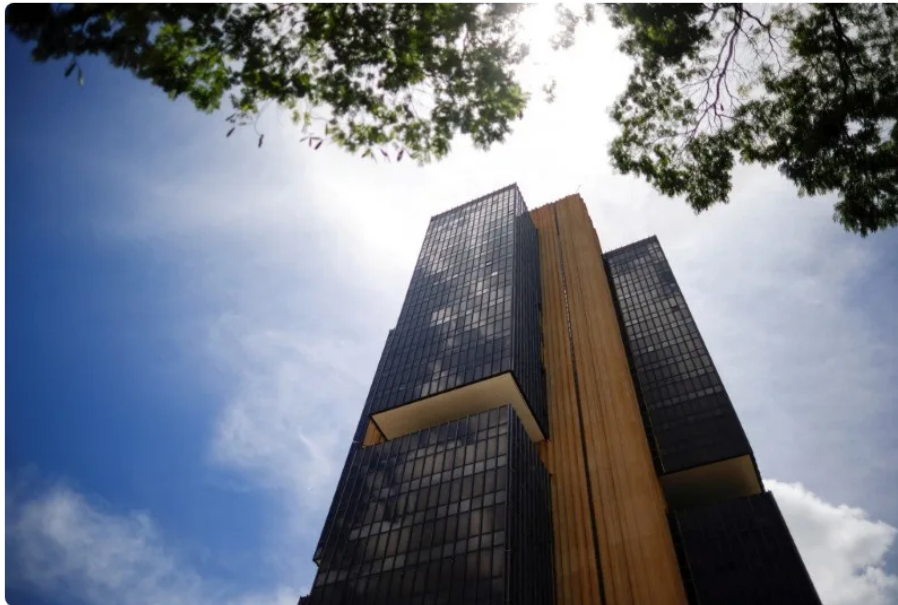
FOTO DE ARCHIVO: Vista general del edificio de la sede del Banco Central en Brasilia

BRASILIA, 26 jun (Reuters) - El superávit de la cuenta corriente de Brasil en mayo fue inferior a las expectativas y se situó en 649 millones de dólares, mostraron el lunes datos del banco central, con un mayor déficit en el pago de factores que eclipsó un sólido superávit comercial.