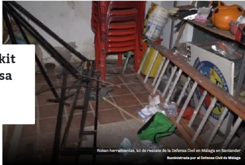
Roban herramientas, kit de rescate de la Defensa Civil en Málaga en Santander