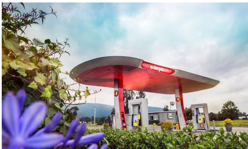
Estación de combustible de Terpel.

De esta compañía, que tiene su domicilio en Bogotá, se puede destacar que, de acuerdo con el informe, vende más que el Éxito, que se ubica en el sexto lugar entre las de mayores ingresos operacionales.