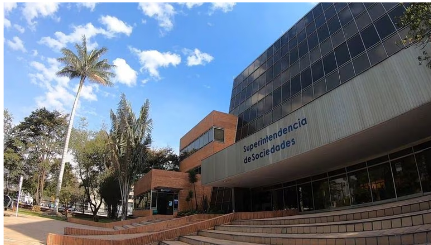
Imagen de referencia. - Foto: Cortesía Superintendencia de Sociedades

De estas, 16 pertenecen al sector de servicios, generando 16 billones de pesos, según los datos de la Superintendencia. Una es del sector minero-hidrocarburos, dos del manufacturero, otras dos son del sector de la construcción y las otras 9 son del comercio.