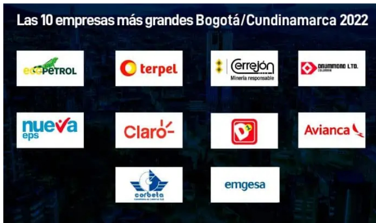
Las empresas más grandes de Bogotá por ingresos operacionales en 2022.