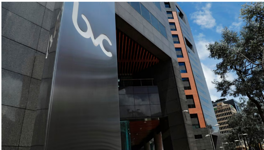
La Bolsa de Valores de Colombia y Ecopetrol no lograron mantenerse a flote este jueves -22 de junio- y completaron un día más con números en rojo.

La Bolsa de Valores de Colombia y Ecopetrol no lograron mantenerse a flote este jueves 22 de junio. Completaron un día más con números en rojo, en un mercado que no logra retomar el buen paso y sigue afectado por el temor a una desaceleración económica más fuerte en los próximos meses, a lo que pueda pasar en Estados Unidos con las tasas de interés y a los efectos negativos de la lucha que libra la Fed contra la inflación, que al parecer no terminarán tan pronto como se esperaba.