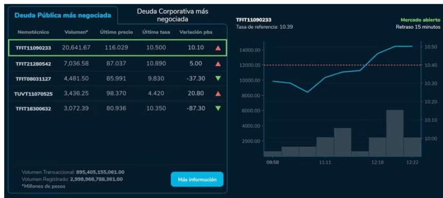
La noticia del día corrió por cuenta del presidente de la Reserva Federal estadounidense (Fed, banco central), Jerome Powell.

La noticia del día corrió por cuenta del presidente de la Reserva Federal estadounidense (Fed, banco central), Jerome Powell, quien señaló este jueves ante una comisión senatorial que es posible que haya dos nuevas subidas de tasas de interés este año.