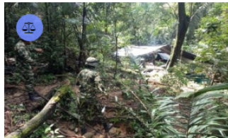
CASANARE / 15 horas ago

Indagan si en la empresa de servicios públicos de Villanueva solicitaron dinero a trabajadores para celebrarle cumpleaños al Alcalde