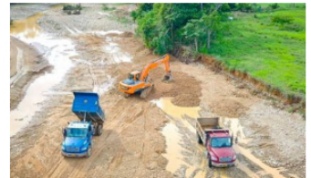
CASANARE / 20 horas ago

Destruído laboratorio para procesamiento de clorhidrato de cocaína en zona rural de Tauramena