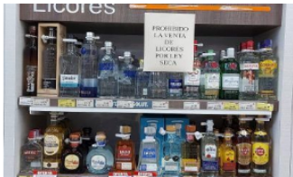
NACIONALES / 20 horas ago

Con cinco frentes de trabajo avanza atención en sitios donde se han presentado emergencias en Casanare