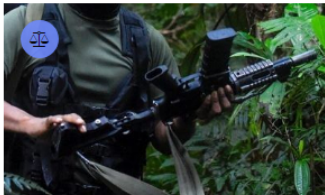
CASANARE / 17 horas ago

Defensoría del Pueblo emite Alerta Temprana para Yopal y Aguazul por accionar de grupos al margen de la ley