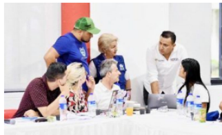
ARAUCA / 20 horas ago

Icetex condonó intereses por $14 mil millones a cerca de 20 mil usuarios