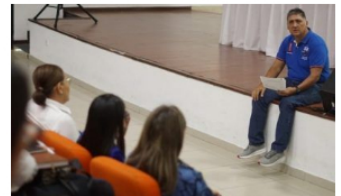
CASANARE / 19 horas ago

Se levanta movilización de comunidades en Arauca tras lograr acuerdos con el Gobierno