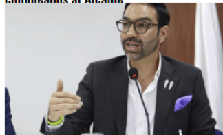
NACIONALES / 20 horas ago

Congreso aprobó histórico cambio para la ley seca en elecciones