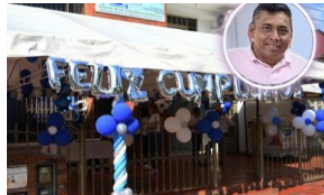
CASANARE / 19 horas ago

Defensoría del Pueblo emite Alerta Temprana para Yopal y Aguazul por accionar de grupos al margen de la ley