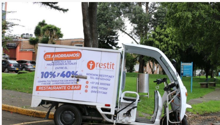
Restit revoluciona la gastronomía con su vehículo