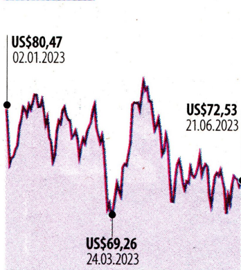
Histórico del WTI