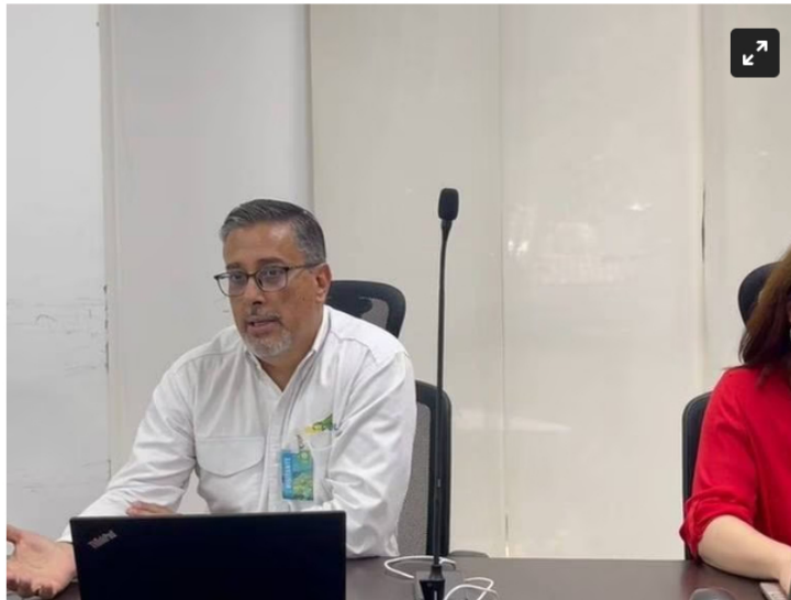
El Ideam y Ecopetrol fortalecen el monitoreo de aguas en Santander

Esto se da luego de la firma del Acuerdo de Cooperación suscrito entre las dos entidades.