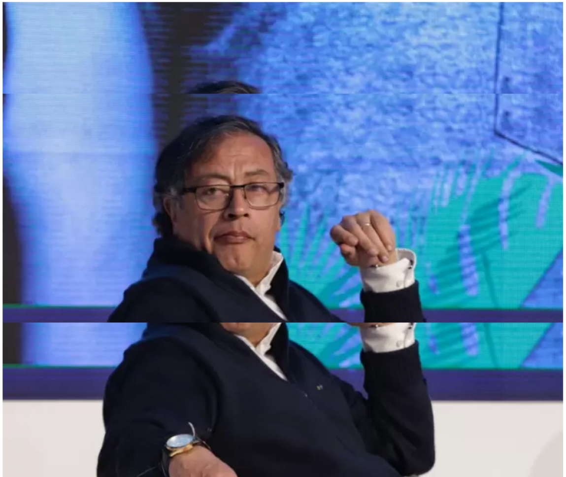
Presidente Gustavo Petro