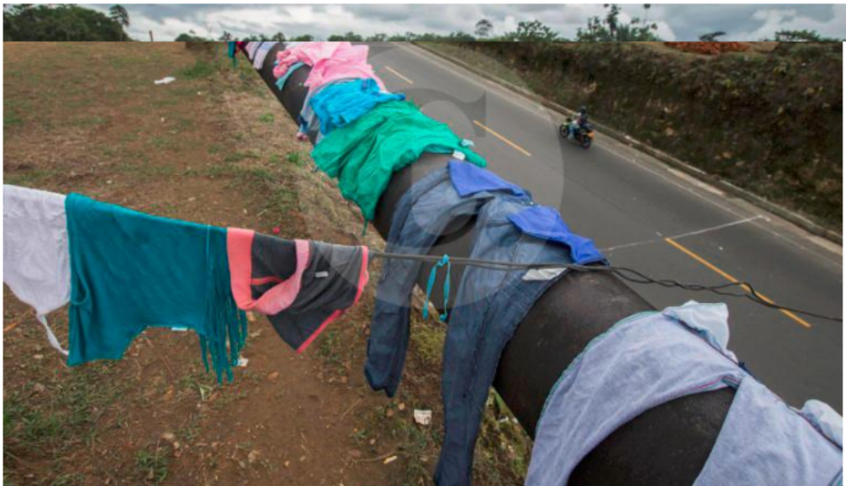
Los delincuentes se aprovechan de la exposición del tubo en la superficie en algunos tramos.

La organización desarticulada cubría todos los eslabones de la cadena para “ordeñar” el oleoducto y llevar el producto hasta centros de consumo.