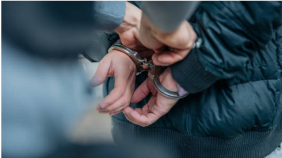
Cárcel para alias 'Víctor', presunto miembro del ELN.

Por: Estefanía Pedraza Bautista Sábado, Junio 17, 2023 - 09:33