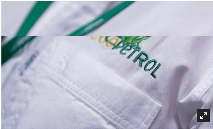
Ecopetrol. Imagen de referencia.

La petrolera espera en este 2023 captar nuevos clientes en Corea del Sur, Malasia, Japón y Tailandia.