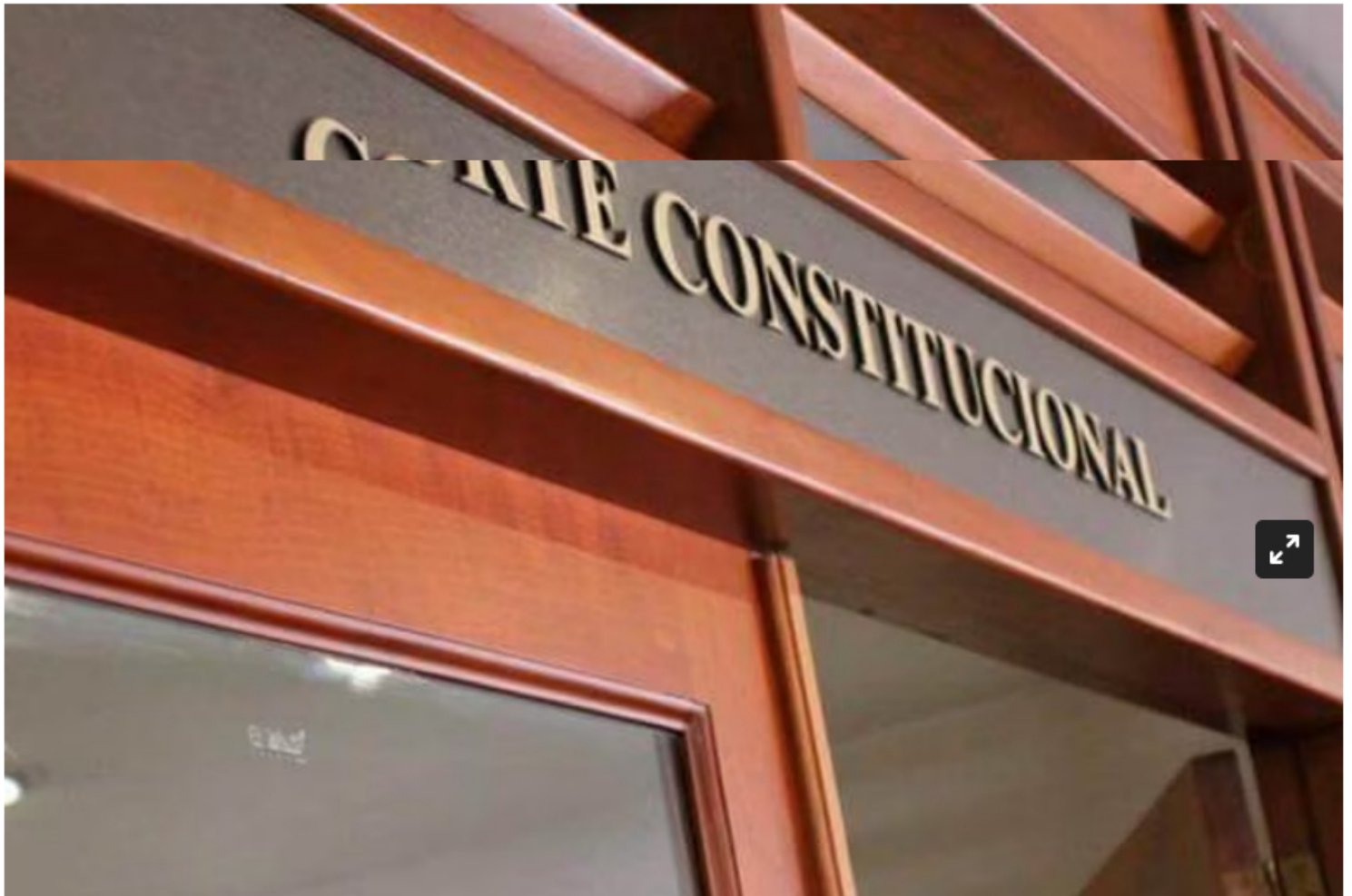
Corte Constitucional / Foto: Colprensa

La Corte también unificó dos de estas demandas que piden tumbar el artículo que eliminó le aumenta el valor del impuesto de renta a las empresas de hidrocarburos.