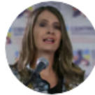
Programa La WRadio