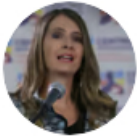
Programa La WRadio