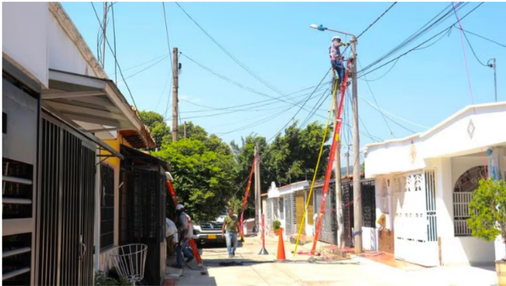
Varios ciudadanos se verán afectados.

San Calixto: Primavera, San Ignacio, San Javier, Bracitos, La Unión, El Perdido, Santa Catalina, La Esperanza y El Caracol.