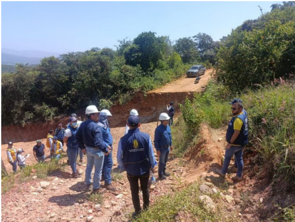
Visita técnica de las autoridades pertinentes.

Lo cierto es que esa visita se llevó a cabo el pasado 3 de mayo y hasta la fecha no se conoce un informe preliminar que determine el día en la que esta vía será reparada. Líderes comunales de la zona exigen a las autoridades pertinentes una respuesta a esta problemática.