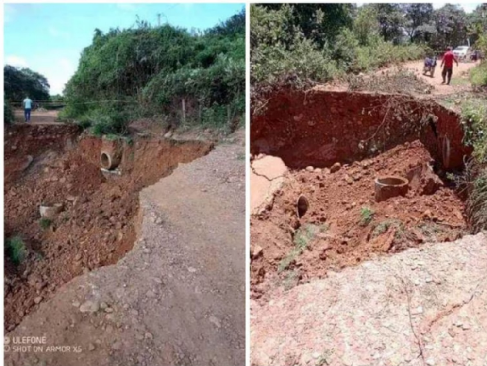
Este derrumbe ocurrió el 26 de abril.

Son más de 56 familias de la zona rural de este territorio que se encuentran afectadas desde el pasado 26 de abril, cuando se presentó esta emergencia, generando que algunos niños no puedan asistir a clases debido a que no hay vía alterna.