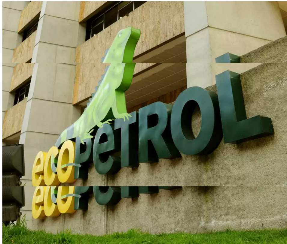
Sede de Ecopetrol