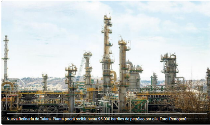
Nueva Refinería de Talara. Planta podrá recibir hasta 95.000 barriles de petróleo por día.

Precio del dólar hoy en Perú: ¿cuál es el tipo de cambio para este viernes 16 de junio?