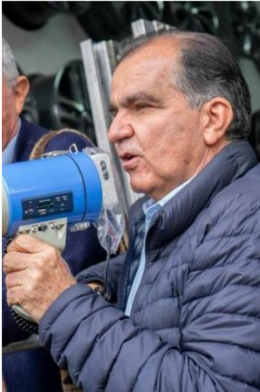
Óscar Iván Zuluaga y Álvaro Uribe Vélez.

Estas tres situaciones muestran una situación recurrente y es que en los últimos 30 años, una buena parte de los presidentes en ejercicio han tenido que hacer frente a señalamientos de entrada irregular de dineros a sus campañas. El primero en el listado fue Ernesto Samper, que tuvo que hacer frente al proceso 8.000.