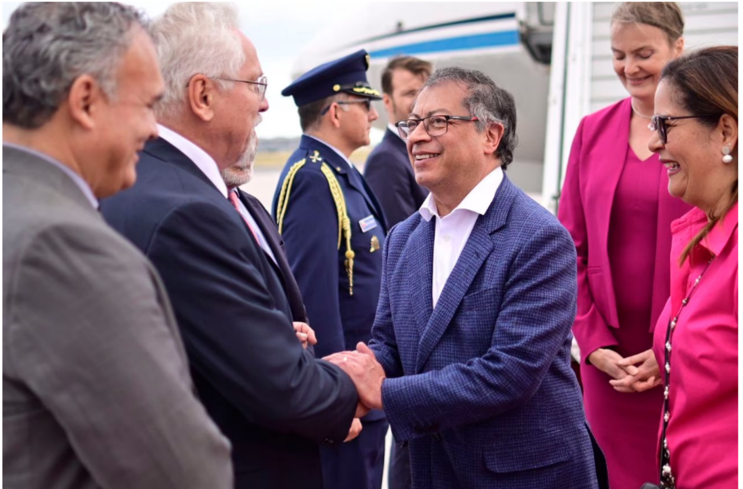
Presidente Gustavo Petro en Alemania.

Asimismo, el jefe del Estado teutón afirmó que era una alegría “poder recibir aquí al presidente Gustavo Petro, en su primera visita como presidente a nuestro país. Usted viene como amigo y como aliado, y acabamos de tener una comunicación muy amigable”.