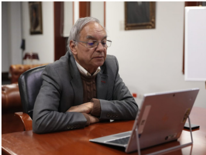
Ricardo Bonilla, ministro de Hacienda.

E l Ministerio de Hacienda está ejecutando una movida de precisión compleja para pagar el enorme hueco fiscal que ha abierto el subsidio a la gasolina. Aún más, el ministro de Hacienda, Ricardo Bonilla, ha esbozado un plan que cerraría uno de los problemas estructurales de las finanzas públicas del país, que se desangran, año a año, con ese subsidio.