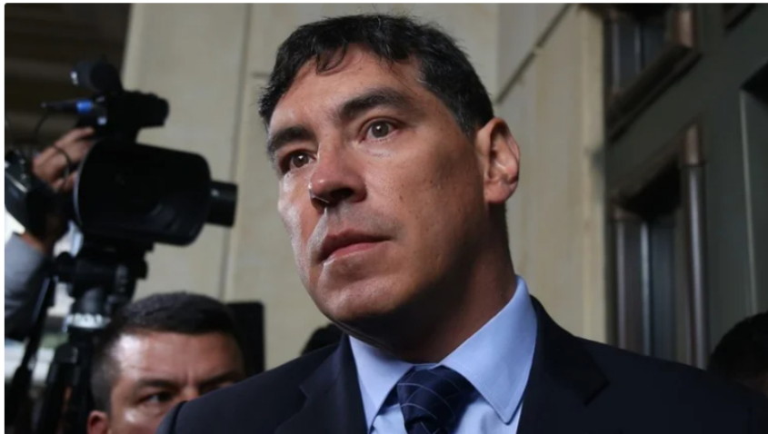
Prada (foto) también fue investigado dentro del caso contra Álvaro Uribe por manipulación a testigos.

En la tarde del jueves 15 de junio se conoció que la Sección Quinta del Consejo de Estado negó una demanda elevada contra la elección de Álvaro Hernán Prada como magistrado del Consejo Nacional Electoral (CNE).