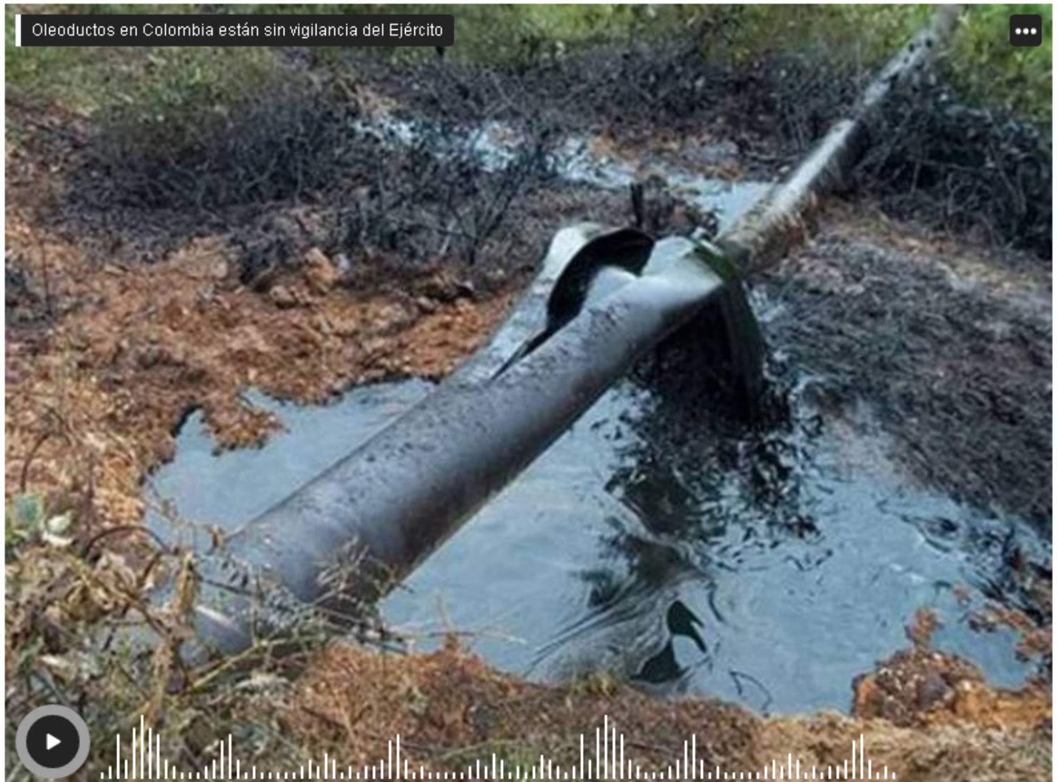
Oleoductos en Colombia están sin vigilancia del Ejército

El Ministerio de Defensa no ha querido renovar los convenios que por muchos años se han firmado entre las Fuerzas Armadas y Cenit, la empresa filial de Ecopetrol encargada de la operación de poliductos, oleoductos y gasoductos en el país, para prestar servicio de seguridad y cuidado a esta infraestructura.