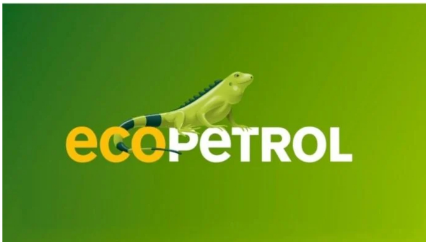
Petrolera estatal colombiana, Ecopetrol .