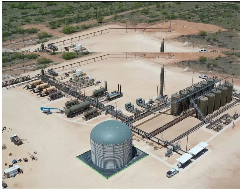
Cuenca Permian de Ecopetrol en Estados Unidos