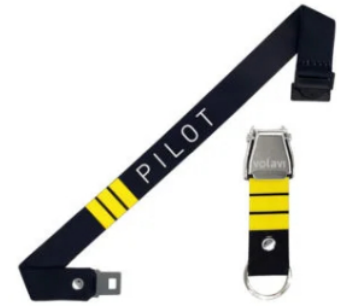
Lanyard (cinta porta carnet) Piloto $64.500