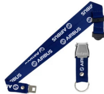
Lanyard (cinta porta carnet) Piloto Airbus $64.500