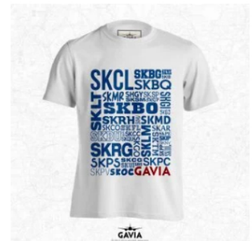
Camiseta (T-Shirt) GAVIA "Airports" Aviación para Hombre $65.000