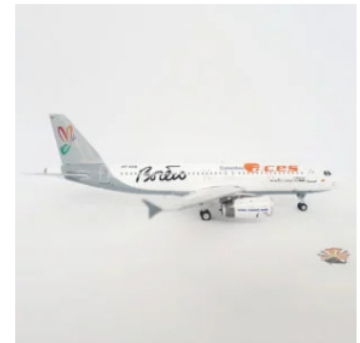
Modelo Aces Airbus A320 Alianza Summa - Escala 1:200 $378.000