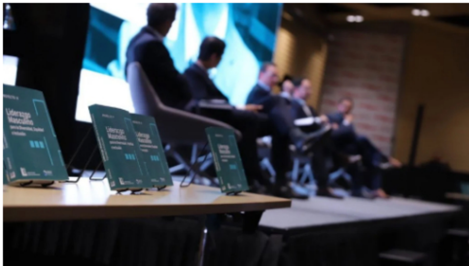
Varios importantes líderes del sector empresarial de Colombia se unieron para la publicación del libro Liderazgo Masculino para la Diversidad, Equidad e Inclusión.

“A través de una conversación entre hombres, líderes y tomadores de decisiones, se busca generar conciencia sobre la responsabilidad del hombre al respecto, invitándolo a ser protagonista del cambio que se necesita y a obtener los beneficios que todos alcanzamos, hombres y mujeres, con una mejor sociedad”, explicó la universidad.