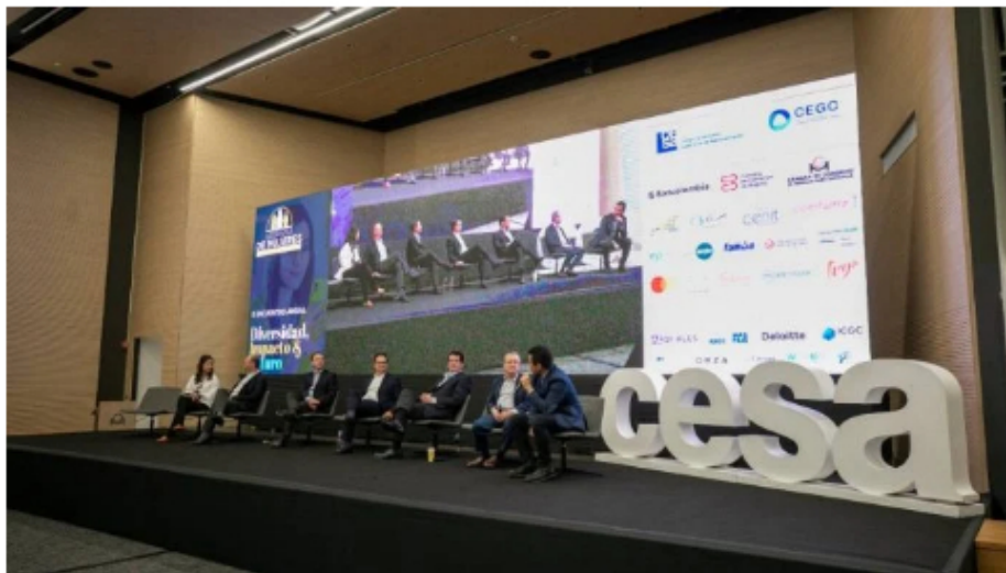
El lanzamiento del libro se hizo en el marco de El rol masculino en el trabajo por la equidad en Colombia.