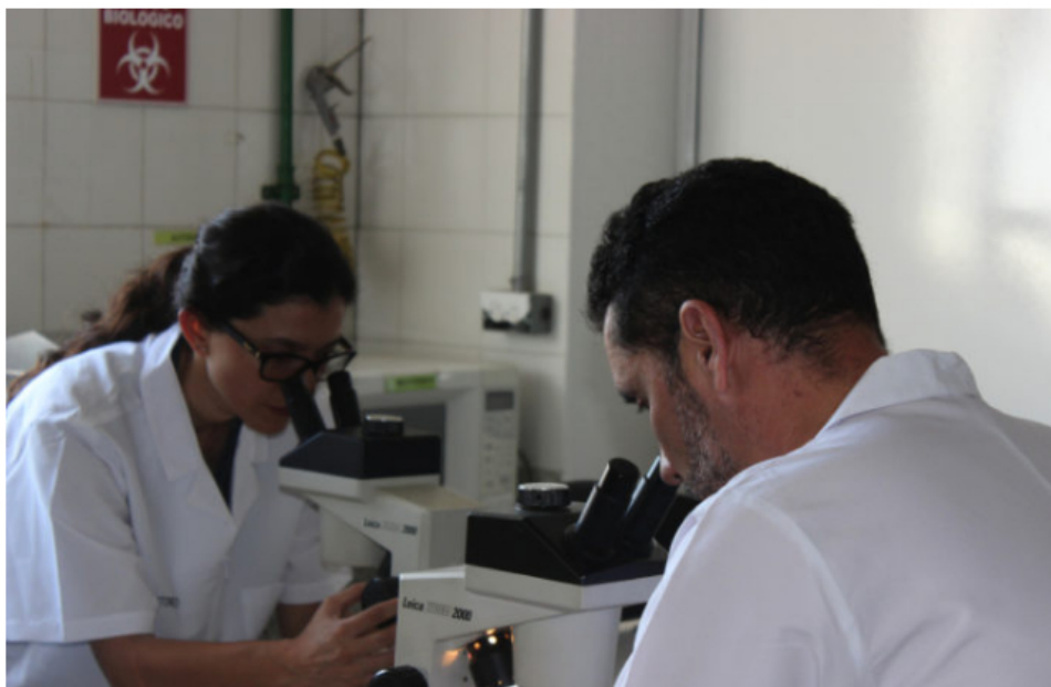
La investigación en ciencia y tecnología será fundamental para un proceso de reindustrialización en el país.

Retomar el camino del desarrollo a partir de profundos cambios en la atrasada estructura de la agroindustria del país necesita aplicar el conocimiento y la ciencia, lo cual requiere máxima financiación