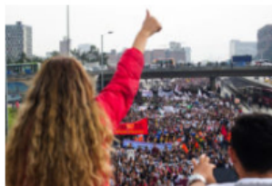
De cordilleras y asambleas: la necesidad de un programa mínimo