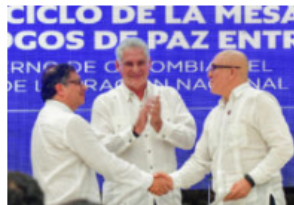
Histórico acuerdo entre Gobierno y FLM