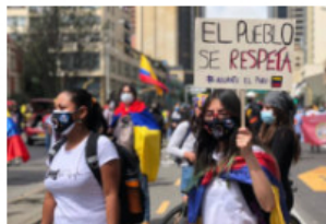
Elecciones y futuro de la CUT