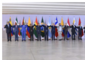
"De nada nos sirvió estar divididos"