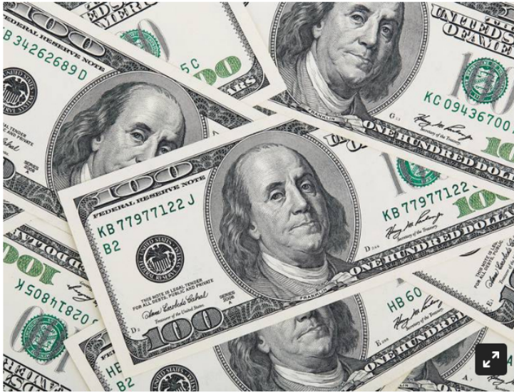
Imagen de referencia de dólares.

Según la explicación desde Reficar, CB&I fue adquirida por la empresa McDermott International Ltd., con todas sus obligaciones y a esa empresa se le cobrarán los 1.000 millones de dólares.