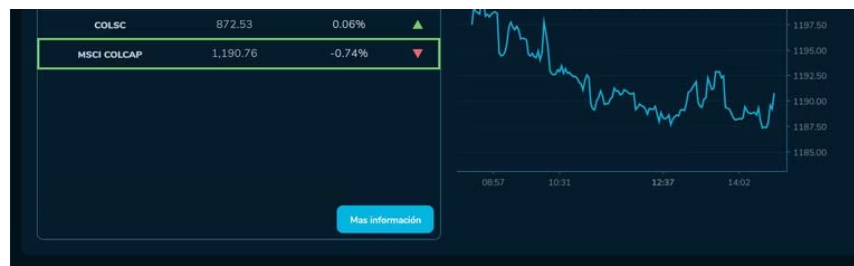
De acuerdo con los valores de cierre para esta oportunidad, el índice MSCI Colcap acabó en 1.190 unidades, retrocediendo de esta forma un -0,74 % respecto a las 1.199 que marcan la referencia.

Con esto se rompe la buena racha que traía este indicador, uno de los más importantes de la bolsa colombiana, que el pasado miércoles terminó en 1.199,68 unidades, creciendo de esta forma 0,49 % respecto a las 1.193 que marcaron la referencia en ese entonces. Si bien los resultados de inflación presentados por el Dane al cierre de la sesión anterior fueron positivos, al parecer la tranquilidad de los operadores sigue afectada y esto se refleja en los resultados del arranque en esta jornada.