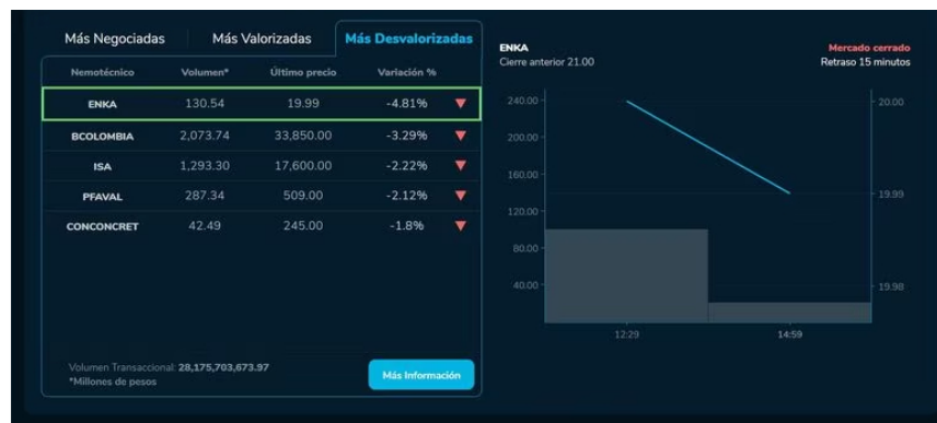
Los mayores desplomes fueron para Enka (-4,81 %), Bancolombia (-3,29 %), ISA (-2,22 %), preferencial Aval (-2,12 %) y Concreto (-1,8 %).

Por último, dando un vistazo a otras empresas que cotizan en la Bolsa de Valores de Colombia, el grupo de las más valorizadas quedó compuesto por BVC (3,04 %), Grupo Energía Bogotá (1,54 %), Cementos Argos (1,06 %) y preferencial Cementos Argos (0,83 %); mientras que los mayores desplomes fueron para Enka (-4,81 %), Bancolombia (-3,29 %), ISA (-2,22 %), preferencial Aval (-2,12 %) y Concreto (-1,8 %).