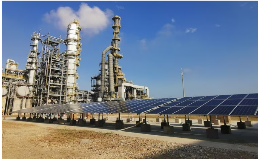
Caso Reficar: Ecopetrol ganó pleito y recibirá millonaria suma en dólares por laudo.

Además, destacó la actuación de los miembros de la junta directiva de Reficar y de los funcionarios de la administración; descartó con firmeza la existencia de acto alguno de corrupción; y puso de relieve la importancia para el país de haber logrado la terminación de esa refinera, destacando la actuación de los decisores y las decisiones que se tomaron.