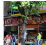
¿Bajó el precio del pollo asado en Colombia? Esto dicen las cifras