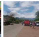
Ataques a bala y a puñaladas dejaron tres heridos en Cúcuta

Las mejores Empresas De Norte de Santander