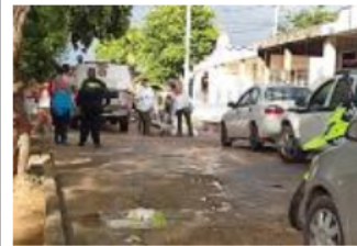
Cúcuta amaneció con un nuevo asesinato