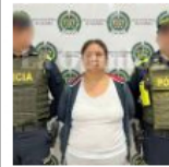
Capturan a la presunta homicida de un bebé en Cúcuta